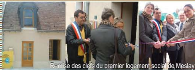
Remise des clés du premier logement social de Meslay