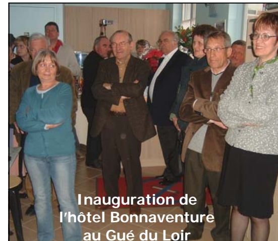
Inauguration de l'hôtel Bonnaventure au Gué du Loir