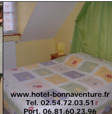
www.hotel-bonnaventure.fr Tel. 02.54.72.03.51 Port. 06.81.60.23.96