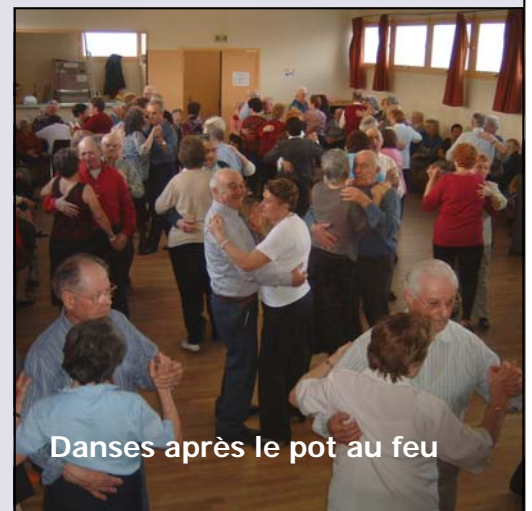
Danses après le pot au feu