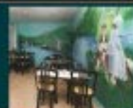
Salle peut déjeuner et réunion