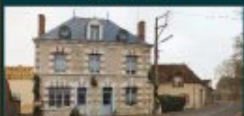
Vue d'ensemble de l'hôtel